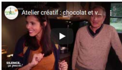
Silence ça pousse - France 5