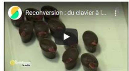
La Quotidienne la suite - France 5